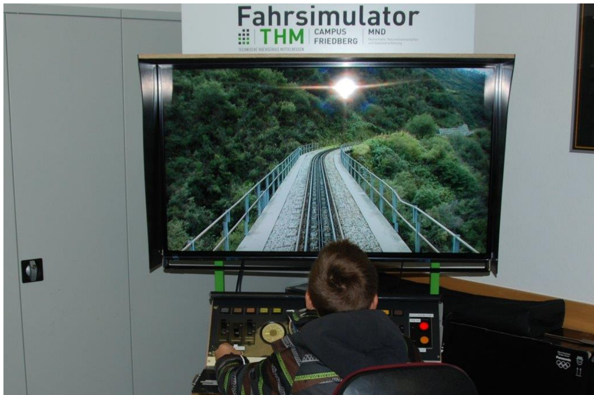
Mittels originalgetreuer Bedienelemente wird eine Zugfahrt simuliert, auf welchen der Lokführer in Spee über einen Monitor direkt Einfluss hat.