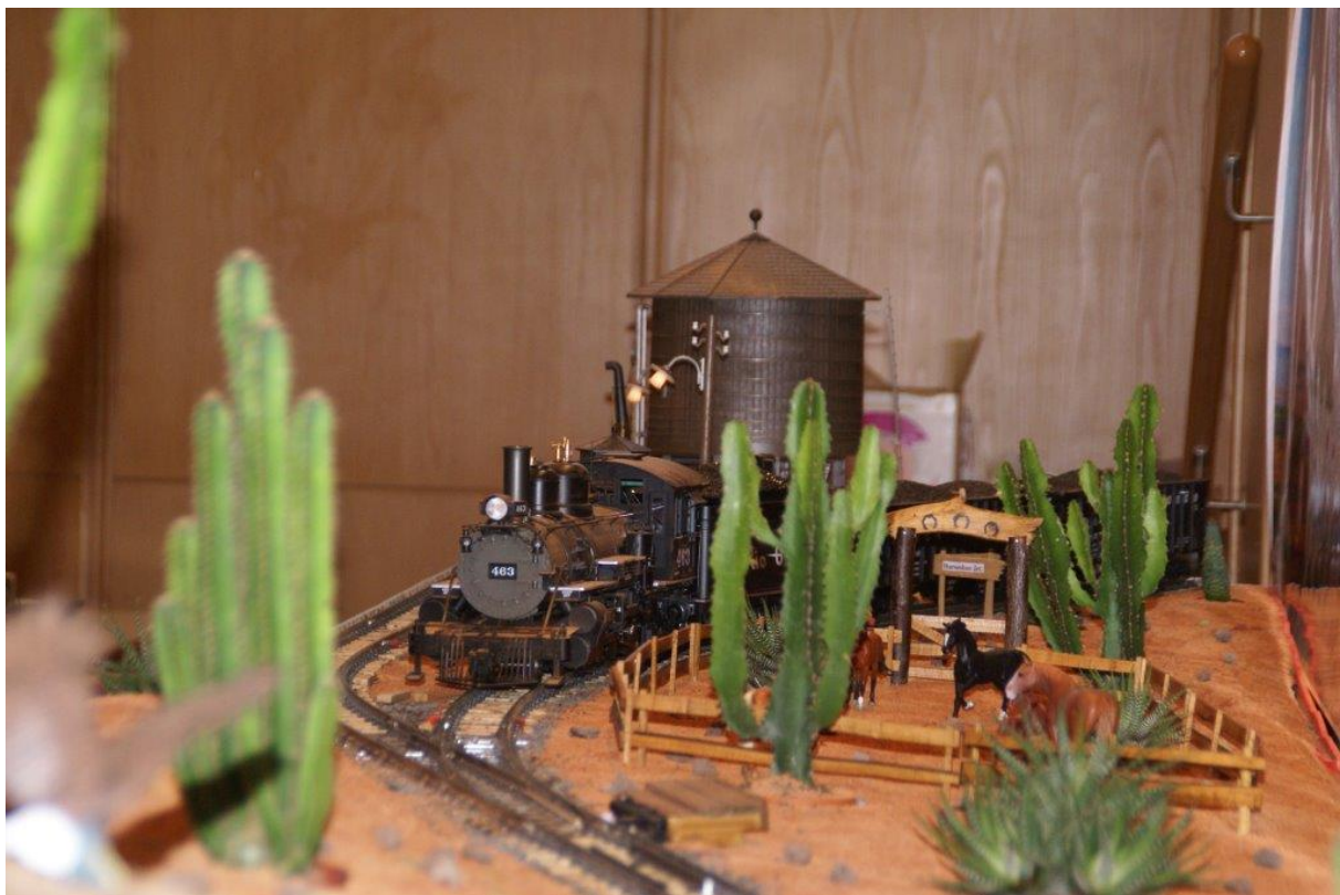
Durango Yard in Spur 2m mit Lok Typ K27 von Gerd Hegny

Im Wilden Westen spielt eine Szenerie mit einer Lok des Typs K27. Diese fährt auf Selbstbauweichen. Alles in Allem eine stachelige Angelegenheit.