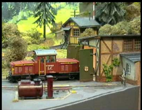
Anlage WEK von Werner Knopf