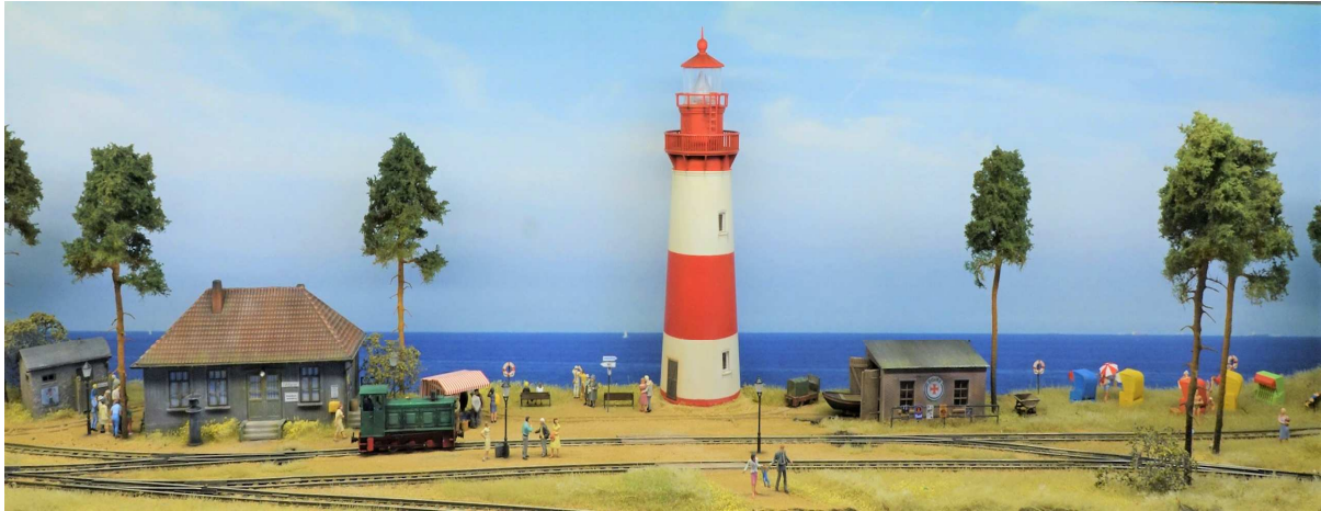
Anlage Küstenbahnbahn von Wolfgang Stößer

Weiterhin zeigen wir eine Küstenbahn, eine bis ins letzte durchgestaltete H0e Anlage vom Feinsten. Ein Rückblick auf den letzten Sommer mit Badefreuden ist. Die Anlage hat in Bad Homburg Premiere.