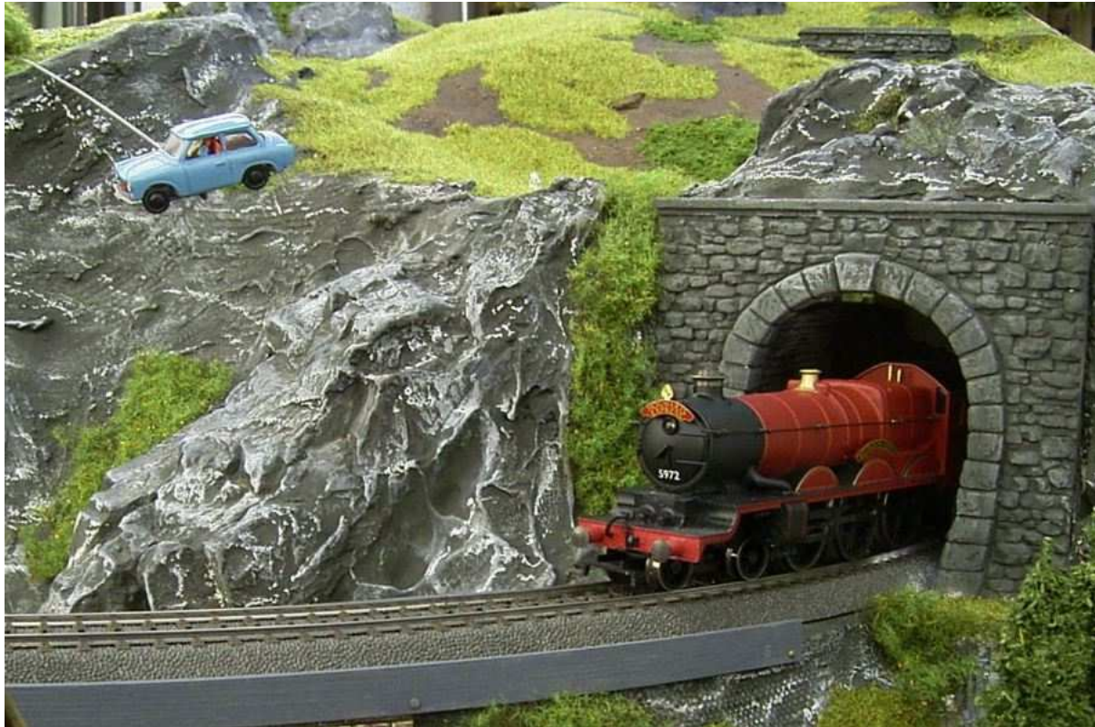
Harry Potter Anlage mit fliegendem Auto der IGE

Im Maßstab 1:87 zeigen wir mal wieder die WEK-Anlage von Werner Knopf. Eine Anlage mit vielen bewegten Figuren, welche man einfach gesehen haben muss. Ob es der kurbelnde Drehscheibenwärter, ein winkender Passant, oder einfach die wartenden, den Kopf drehenden Personen an der Bahnschranke sind. Den mit dem Schwanz wedelnden Hund nicht zu vergessen. Die viele Details wissen zu begeistern.