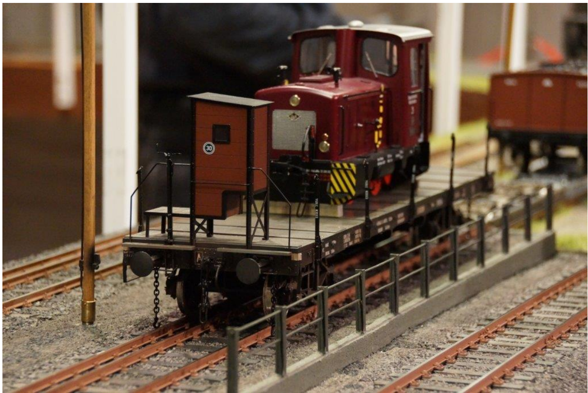
Anlage Groote: Umsetzgleis von Spur II auf Spur IIm