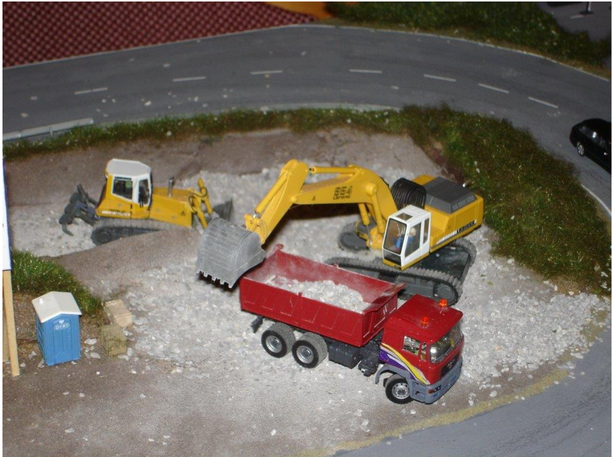
Ferngesteuerte Bagger und Lastwagen im Maßstab 1:87 (H0)

Ferngesteuerte Autos im Maßstab 1:87 werden über ein 6 Meter langes Geländemodul fahren. Es ist spannend zu sehen, wie ein Löffelbagger einen Lastwagen belädt, welcher sich dann auch in Bewegung setzt.