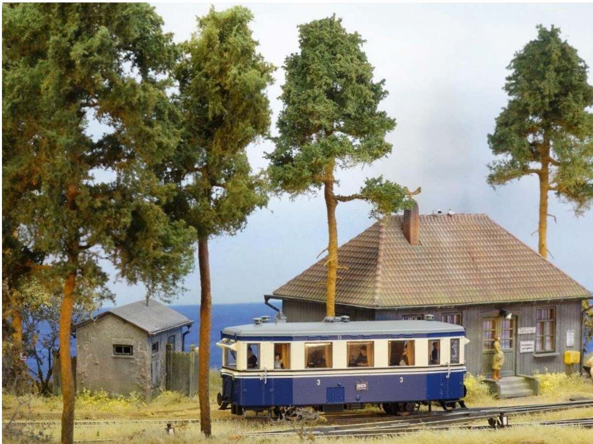
Anlage Küstenbahnbahn von Wolfgang Stößer