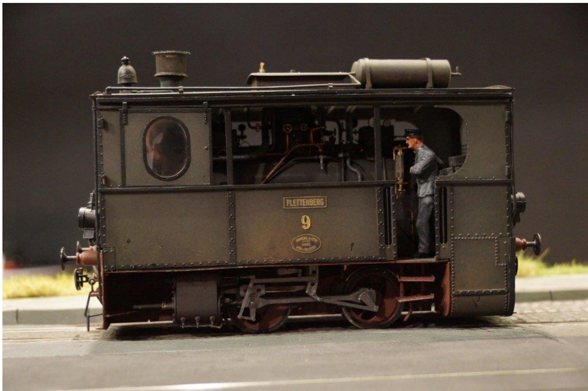
Anlage Groote: Kastenlok Plettenberg in Spur IIm, Ament

Hauptattraktion ist in diesem Jahr eine modulare Anlage in Spur II/IIm, Maßstab 1:22,5. Sie hat aber außer der Spurweite nichts mit einer Gartenbahn gemein, da hier Kleinserie oder Selbstbau angesagt ist. Sie hat eine Abmessung von ca.10 x 6 Metern. Die Anlage ist Motiven der Hohenlimburger- und der Plettenberger Kleinbahn nachempfunden. Es wird ein abwechslungsreicher Betrieb geboten.