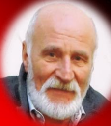
F-J Huwig Spur Z Freunde SAARPFALZ